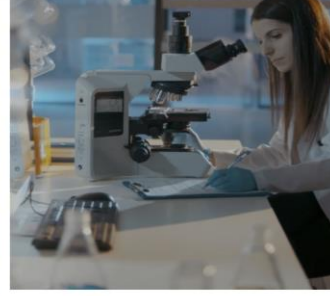
we • innovate