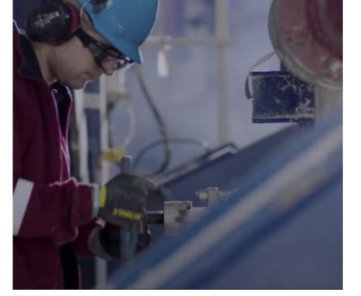
we • challenge